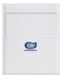
Protetor de assento