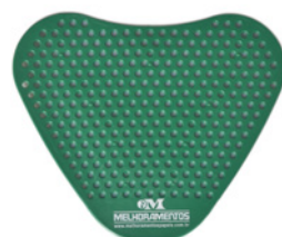
Tapete para mictório