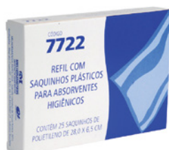
Descarte de absorvente